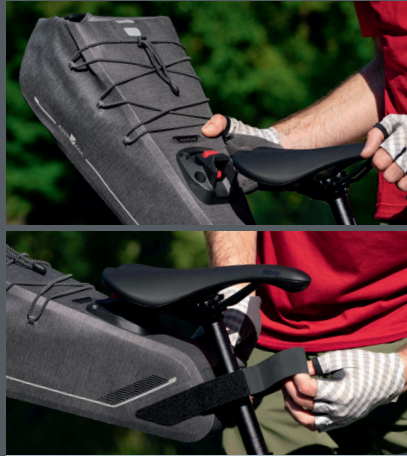
2 point fixation