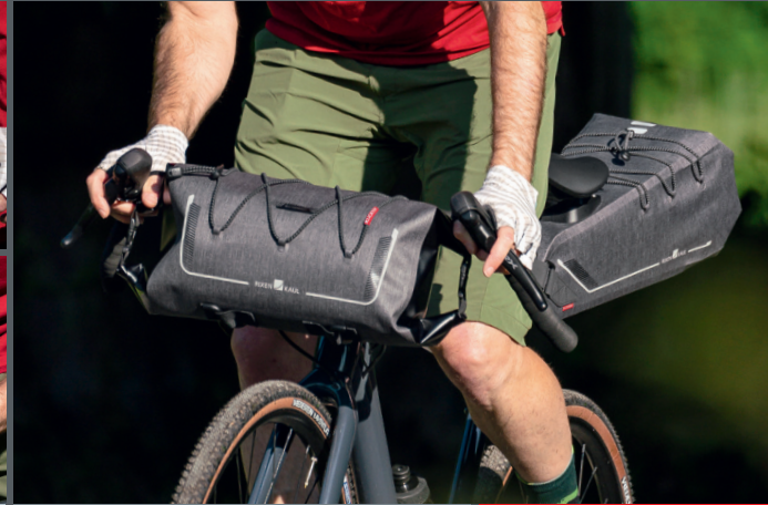
quick release system